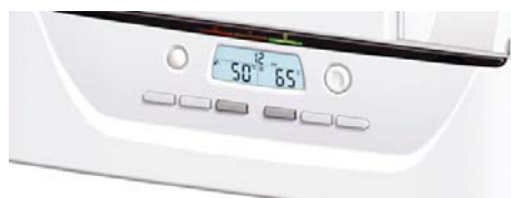
Přehledný ovládací panel pro snadnou obsluhu s velkým podsvíceným displejem