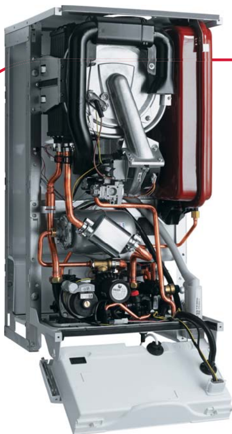
Nová konstrukce kondenzačního kotle s vestavěným zásobníkem Protherm Tiger Condens