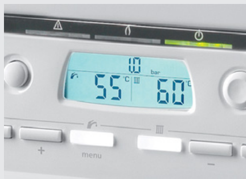
Přehledný ovládací panel pro snadnou obsluhu s velkým podsvíceným displejem