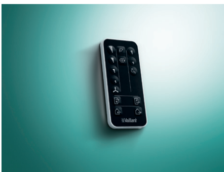
Standardní dálkové ovládání

Omyvatelné vnitřní filtry, stejně jako samotný keramický výměník tepla, dělají jednotku recoVAIR VAR 60 velmi snadno udržovatelnou.