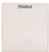
Senzor kvality vzduchu CO 2 - Pro měření obsahu CO 2 k regulaci objemového průtoku vzduchu