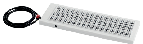
Elektrický předehřívací registr - Pro zajištění provozu i při teplotách hluboko pod bodem mrazu