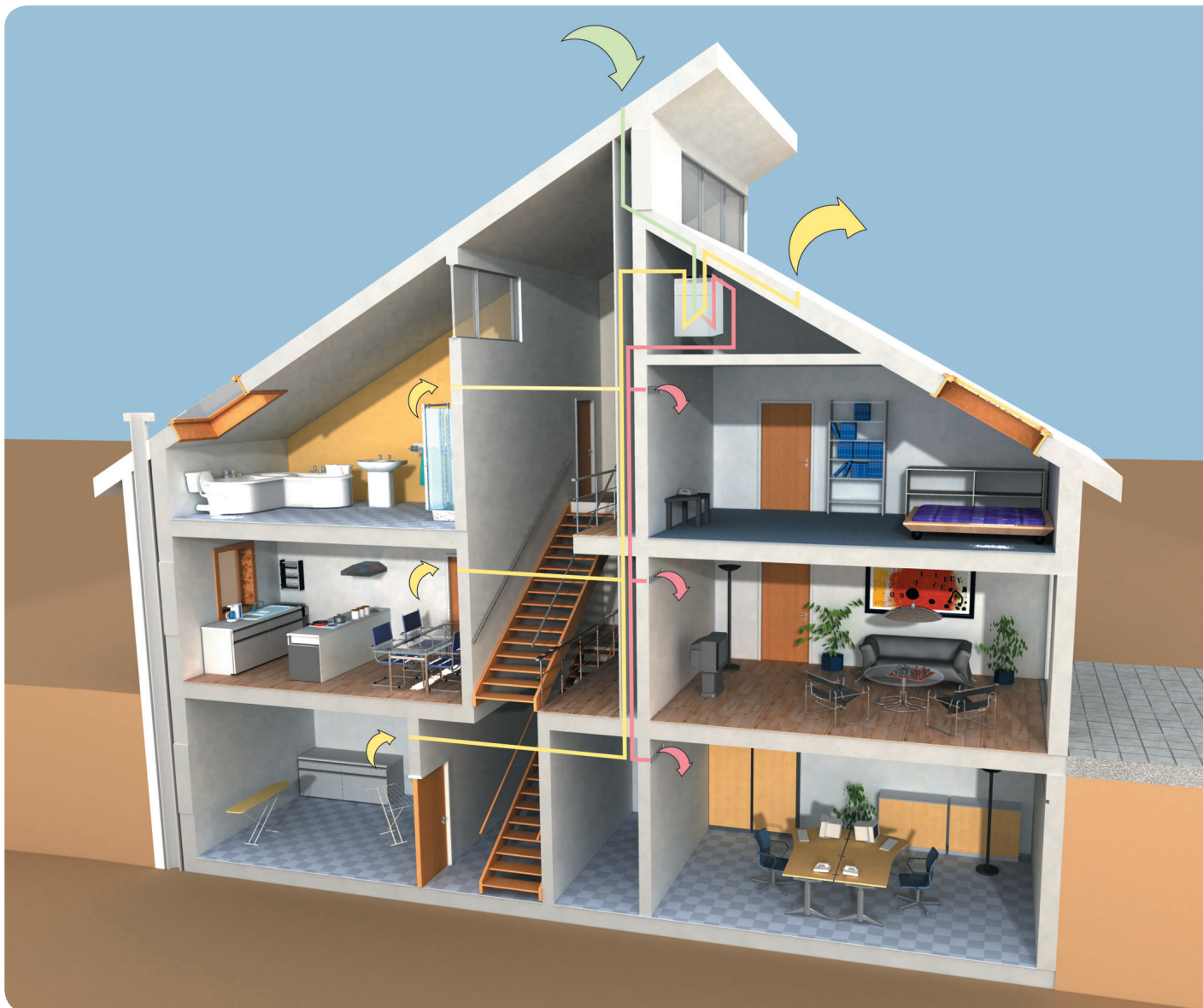
Princip systému recoVAIR