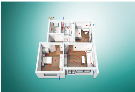
Příklad systému s recoVAIR VAR 60/1