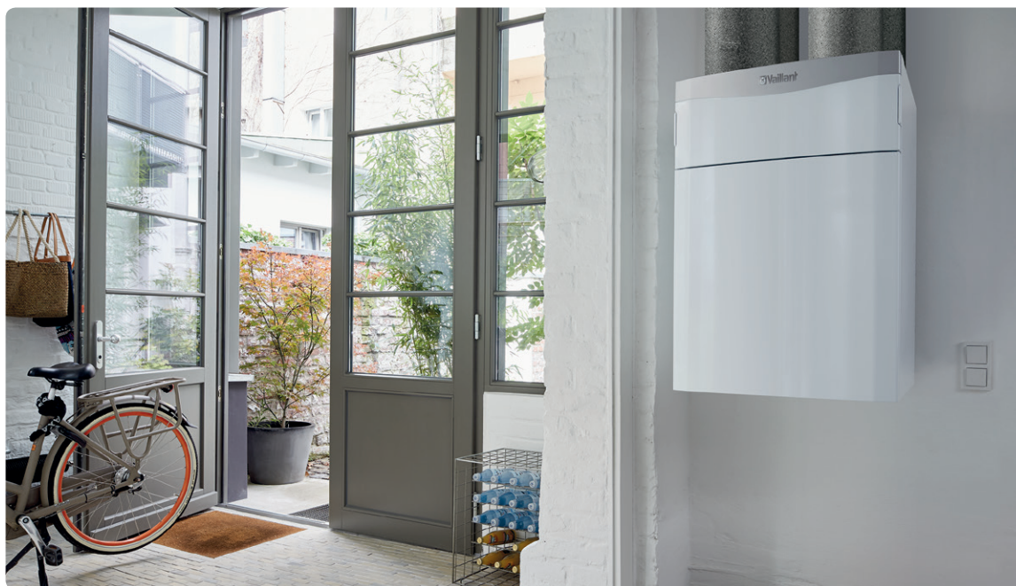
recoVAIR VAR 260/4 a 360/4