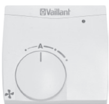
Dálkový ovladač větrání - Třístupňový spínač plus automatický provoz