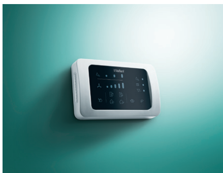
Ovládací panel s integrovaným senzorem CO 2